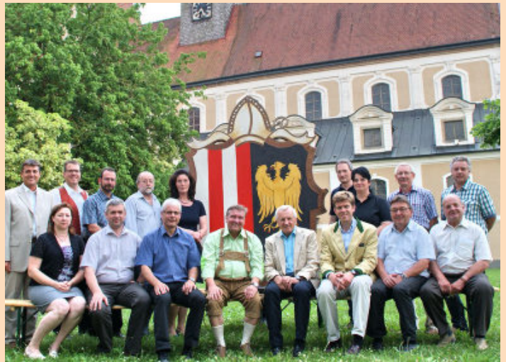
Gruppenfoto mit den Gemeindevertretern der Region Machland

Unter dem Motto "Das Machland - Von Donau und Mensch gemacht - Wo Oberösterreich sein Wappen nahm" hat sich die Region Machland mit den Gemeinden Klam, Baumgartenberg, Arbing, Mitterkirchen, Saxen, Naarn, Perg und Grein um die Landesausstellung 2020 - 2028 beworben. Nach fast einjähriger Wartezeit wurde uns Anfang Juli 2013 mitgeteilt, dass die Region Machland im vorhin genannten Zeitrahmen Standort für eine Landesausstellung sein wird. Die Gemeinde Arbing soll in diesem Zusammenhang ein Nebenstandort werden, zumal unsere einzigartige Wehrkirche am Schloßberg eine enge geschichtliche Beziehung zur Burg Klam aufweist. Welche Rolle unser Ort mit seinen Sehenswürdigkeiten in dieser Ausstellung spielen wird, kann erst nach Zuordnung des Jahres durch die OÖ-Landesregierung festgelegt werden.