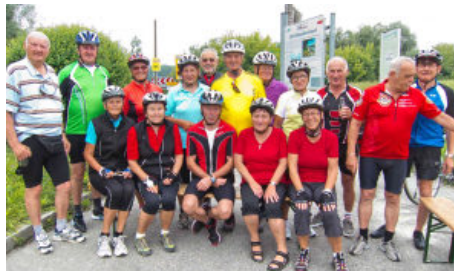
Gruppenfoto bei der Labstelle in Hütting-Mitterkirchen.