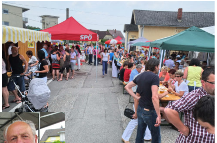
Das Bahnhofsgelände war bis auf den letzten Platz gefüllt.

Nicht nur die sommerliche Hitze sondern vor allem der große Andrang an hungrigen Gästen trieb den unzähligen Helfern den Schweiß auf die Stirn. Während die Erwachsenen den Nachmittag mit den Rhythmen des Duos MIASANMIA gemütlich ausklingen ließen, zeigten die Kinder ihre Ausdauer in der Hüpfburg und bei der Bewältigung der vielen verschiedenen Herausforderungen des Kinderprogrammes. Kleine Geschenke, Süßigkeiten, Popcorn und Luftballons winkten als Belohnung für die Anstrengungen.