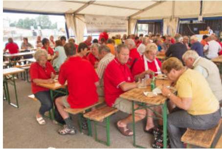
Zum Abschluß gab es das verdiente Mittagessen am Bahnhof-Arbing (Foto oben).