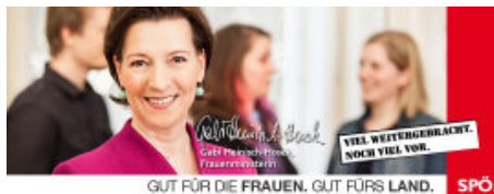
GUT FÜR DIE FRAUEN. GUT FÜR'S LAND. SPÖ.